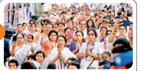
जय भीम जय संविधान...जयधोष संग....